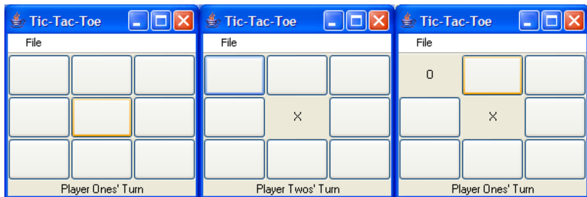
Gambar 8.2 : Program Tic-Tac-Toe

Extend program papan Tic-Tac-Toe yang telah Anda kembangkan sebelumnya dan tambahkan event handlers ke kode tersebut untuk membuat program berfungsi penuh. Permainan Tic-Tac-Toe dimainkan dengan dua pemain. Pemain mengambil giliran mengubah. Setiap giliran, pemain dapat memilih kotak pada papan. Ketika kotak dipilih, kotak ditandai oleh simbol pemain (O dan X biasanya digunakan sebagai simbol). Pemain yang sukses menaklukkan 3 kotak membentuk garis horisontal, vertikal, atau diagonal, memenangkan permainan. Permainan akan berakhir ketika pemain menang atau ketika semua kotak telah terisi.